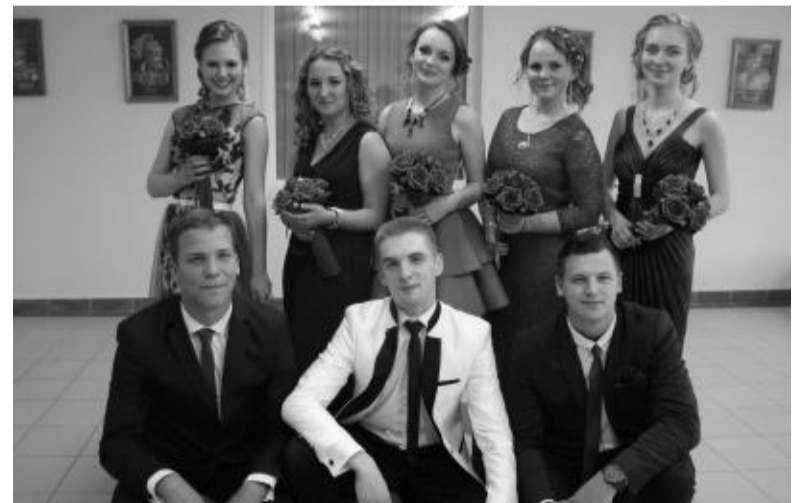
Besišypsantys Pelesos 17 laidos abiturientai.