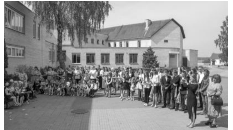
Paskutinio skambučio šventėje – mokytojai, mokiniai, jų tėvai ir svečiai.