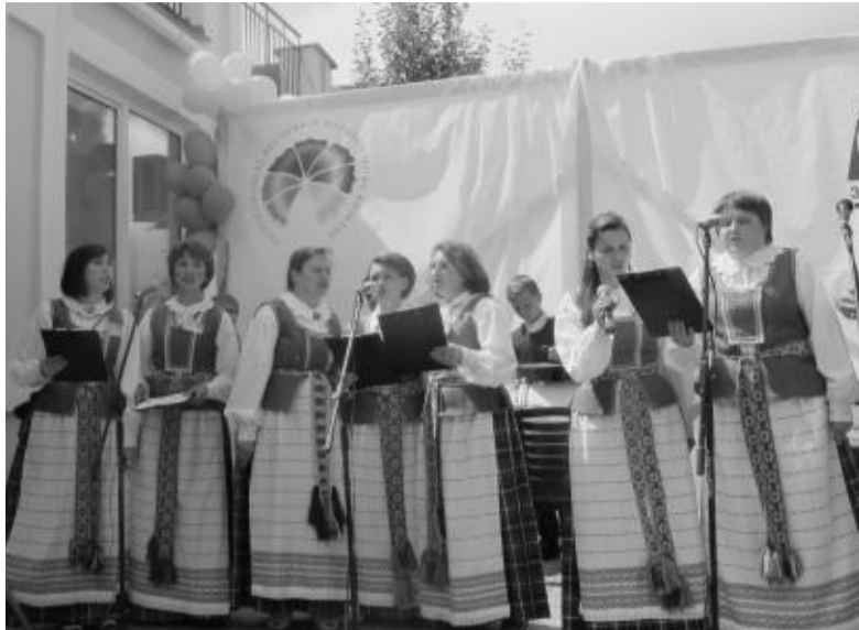
Koncertuoja Pelesos mokytojai.