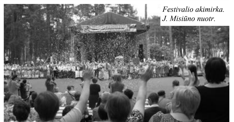
Festivalio akimirka.